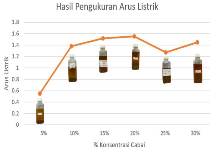
Gambar 2. Grafik hubungan antara arus listrik dengan konsentrasi cabai

Parameter kedua yang diuji adalah kuat arus listrik. Arus listrik merupakan aliran yang muncul dikarenakan adanya muatan elektron yang mengalir dari titik yang satu ke titik lainnya yang terjadi pada suatu rangkaian. Berdasarkan gambar 2 grafik hubungan kuat arus listrik dengan konsentrasi cabai pada chili oil , maka hasil penelitiannya tidak dapat disimpulkan pula dikarenakan grafik pada konsentrasi cabai 25% terjadi penurunan, sehingga grafik yang dihasilkan berfluktuasi. Pada konsentrasi cabai 5% arus listrik yang dihasilkan sebesar 0,55 mA, 10% 1,38 mA, 15% 1,52 mA, 20% 1,55, 25% 1,27%, dan pada konsentrasi cabai 30% dihasilkan arus listrik sebesar 1,45%. Dari hasil tersebut bisa dikatakan bahwa konsentrasi cabai tidak berpengaruh terhadap kuat arus listrik yang dihasilkan. Tetapi, selain itu bisa disimpulkan bahwa cabai mempunyai arus listrik yang kecil. Arus listrik yang kecil ini disebabkan karena pH pada cabai yang berkisar 6-7. Kesimpulan ini didasari dari penelitian yang dilakukan oleh (Atina, 2015) yang menyatakan bahwa Nilai pH berbanding terbalik dengan kuat arus listrik karena semakin besar pH maka ion penghantar akan semakin sedikit sehingga tegangan dan kuat arus listrik semakin kecil dan sebaliknya.