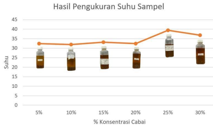
Gambar 6. Grafik hubungan antara suhu dengan konsentrasi cabai

Sifat kelistrikan bahan pangan yang keenam adalah suhu. Suhu merupakan salah satu parameter yang paling sering diukur. Pengukuran ini sangat berguna dalam menganalisa sebuah produk berdasarkan biologi, kimia dan fisiknya (Utama, 2016). Pengaruh suhu dapat berasal dari lingkungan, pemanasan atau cabai itu tersendiri. Pemanasan berpengaruh besar karena saat kompor dimatikan maka suhu di dalam panci atau penggorengan akan turun dan wadah yang digunakan dapat memiliki aliran panas yang membuat suhu di dalamnya berkurang dengan cepat atau lambat. Berdasarkan grafik pada gambar 6, hasil yang didapatkan relatif sama, yaitu dimulai dari konsentrasi 5% pada suhu kurang lebih 30 derajat celcius hingga pada konsentrasi 25% sempat mengalami kenaikan suhu yang signifikan hingga 40 derajat celcius. Hal ini karena beberapa faktor diantaranya wadah yang memiliki transfer panas, lingkungan yang memiliki suhu rendah atau waktu pengecekan suhu.