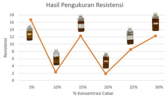
Gambar 3. Grafik hubungan antara resistensi dengan konsentrasi cabai

Sifat kelistrikan bahan pangan ketiga yang diuji adalah resistensi. Resistensi adalah kemampuan suatu benda mencegah dan menghambat aliran arus listrik. Secara teori, jika konsentrasi suatu chili oil semakin tinggi maka tingkat resistensinya akan semakin tinggi. Hal yang menjadi penyebabnya adalah karena cabai memiliki senyawa kimia sebagai penyusun. Senyawa kimia yang paling besar didalam cabai adalah capsaicin. Capsaicin adalah senyawa bioaktif yang terdapat didalam cabai yang dapat menimbulkan rasa panas dan pedas. Namun, kadar senyawa yang terdapat didalam cabai tidak selalu sama. Penyebab perbedaan ini adalah seperti faktor jenis cabai, perawatan cabai dan faktor lingkungan penanaman cabai. Namun, berdasarkan tabel hasil penelitian ditemukan anomali yang sangat signifikan. Pada sampel dengan tingkat konsentrasi 10%, 20% dan 25% memiliki tingkat resistensi yang lebih rendah dibandingkan konsentrasi 5% dan 15%. Hal ini disebabkan oleh beberapa faktor, seperti kesalahan dalam mengolah produk dan kesalahan ketika melakukan pengujian. Contoh kesalahan dalam pengujian seperti tidak melakukan pengamatan secara tepat ketika menggunakan alat uji arus listrik dan kesalahan dalam melakukan perhitungan dan pengolahan data.