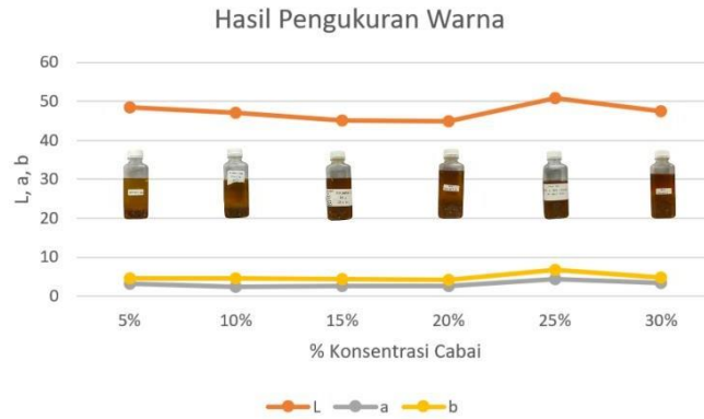
Gambar 4. Grafik hubungan antara warna dengan konsentrasi cabai

Sifat kelistrikan bahan pangan keempat yang diuji adalah warna. Zat kimia yang dapat menimbulkan warna pada cabai adalah pigmen karotenoid. Kandungan pigmen karotenoid pada cabai dapat menimbulkan warna merah pada cabai. Namun, karoreenoid juga dapat berbeda warna seperti kuning ataupun oranye. Faktor yang menjadi penyebabnya adalah karena jenis dan konsentrasi pigmen karotenoid didalam cabai tersebut. Warna cabai sangat mudah berubah ketika mengalami pemanasan disaat proses pemasakan.